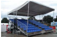
Mobil - Tribüne TR122

Fläche 155m 2 / Breite 13,5m x Tiefe 11m / Preis auf Höhe 1,4 - 2,0m / Boden 500kg/m 2 / Anfrage Bühnendach: Breite 13,5m x Tiefe 13,0m / Lichthöhe 8,0m / Belastung: Sound 2x 1500kg, Light 16x 500kg