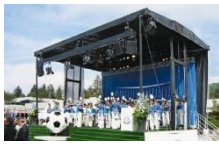
Mobil - Bühne SL300

Fläche 84m 2 / Breite 10,5m x Tiefe 8,0m / Preis auf Höhe 1,3 - 1,8m / Boden 500kg/m 2 / Anfrage Bühnendach: Breite 11,5m x Tiefe 10,5m / Lichthöhe 6,1m / Belastung: Sound 2x 1000kg, Light 8x 500kg