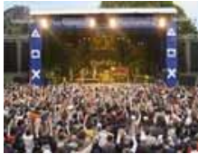
Mobil - Bühne SL400

Fläche 84m 2 / Breite 10,5m x Tiefe 8,0m / Preis auf Höhe 1,3 - 1,8m / Boden 500kg/m 2 / Anfrage Bühnendach: Breite 11,5m x Tiefe 10,5m / Lichthöhe 6,1m / Belastung: Sound 2x 1000kg, Light 8x 500kg